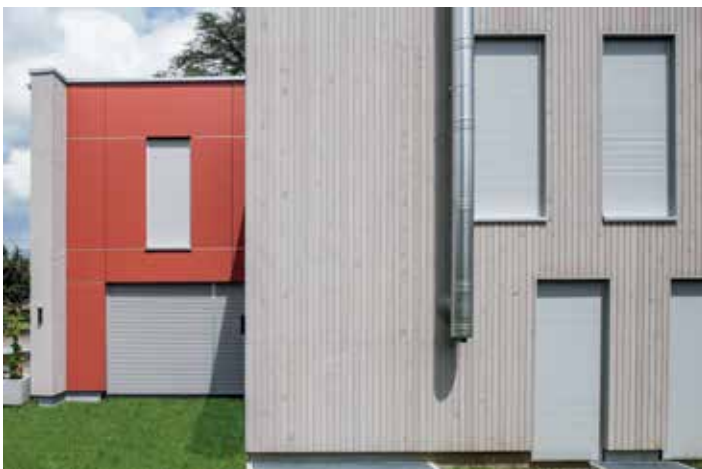
Privaten Wohnbauten verleiht Regapak® sowohl im geschlossenen Zustand als auch in den verschiedenen Gebrauchspositionen ein klares, modernes Erscheinungsbild.